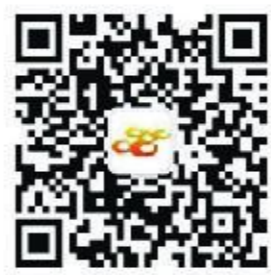
南靖之窗微信公众号

主管、主办：中共南靖县委宣传部 对开4版 刊号：CN-35(Q)第0036号 出版：南靖县融媒体中心 主编：陈瑞章 刊期：周报