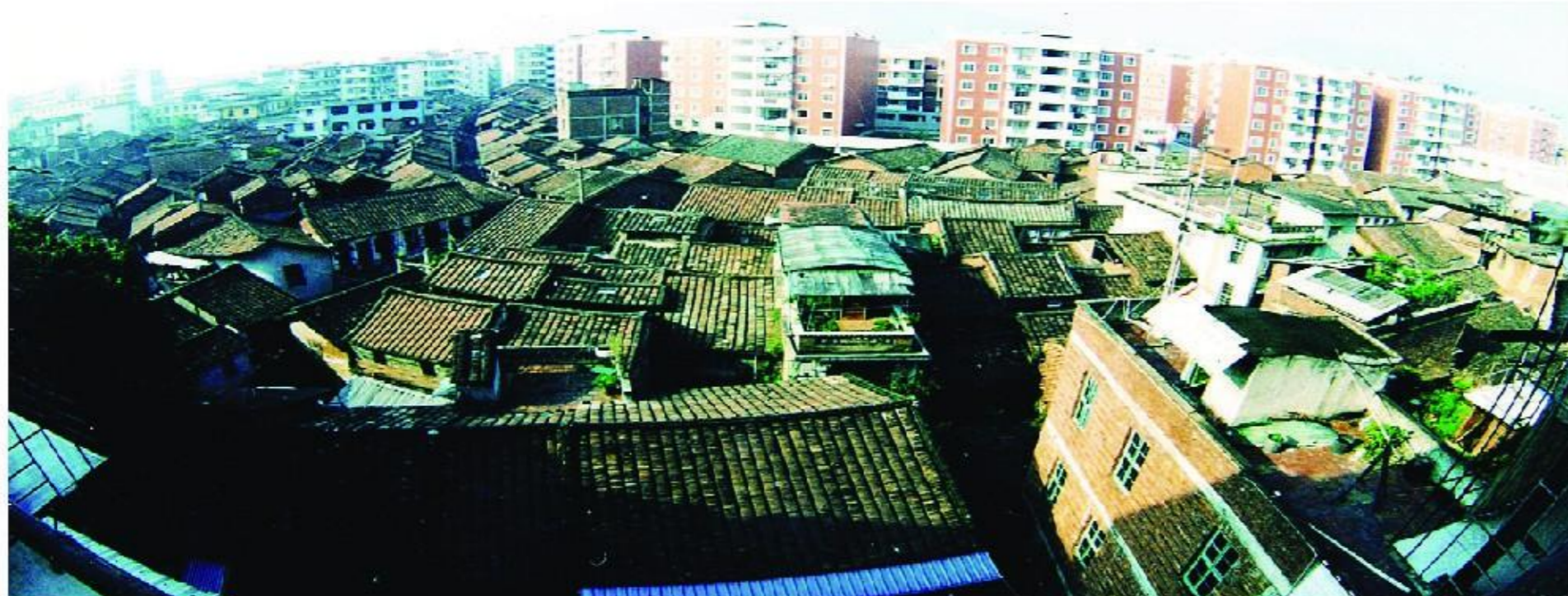
2003年的南靖县城老街与新楼