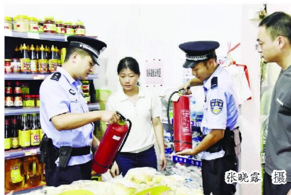
本报讯(记者 尤惠荣 张晓露 通讯员 简雅玲)为切实做好国庆节

期安全防范工作,确保游客及人民群众生命财产安全,营造和谐安全稳定的旅游环境。9月26日,土楼管委会联合书洋市场监督管理所、土楼110、土楼综合执法大队等部门开展国庆节前安全生产检查工作。