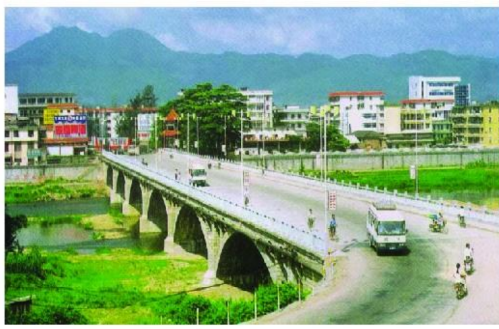
20世纪90年代的南靖大桥