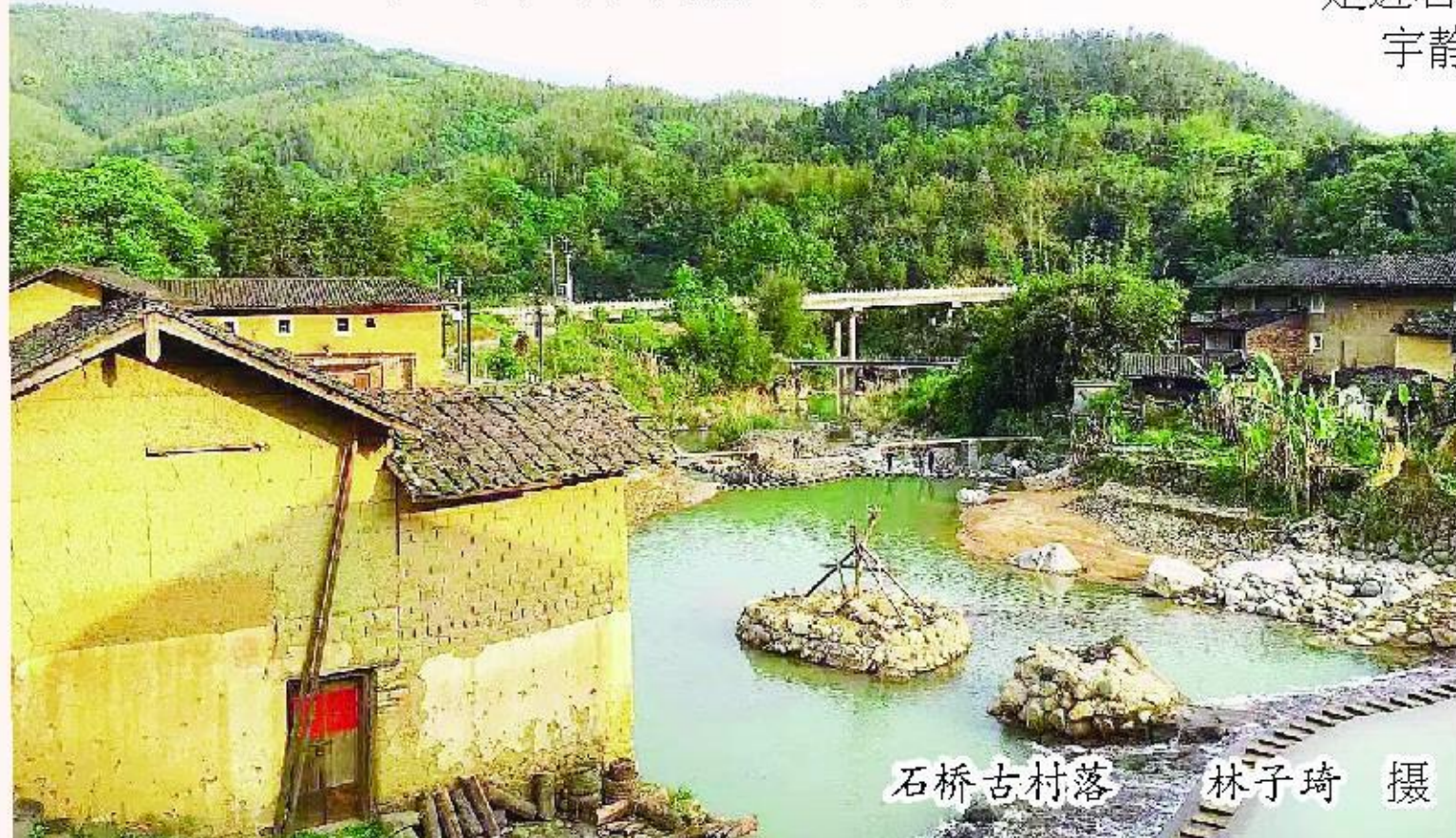
石桥古村落

秋天的田野,是石桥村最具生机的地方。金黄的稻穗沉甸甸地低垂着,仿佛向人们展示着丰收的喜悦。微风拂过,稻浪翻滚,发出沙沙的声响,如同大自然演奏的丰收进行曲。田边的果树上,挂满了红彤彤的“柿柿如意”“心想柿成”,散发着诱人的香气。农民们忙碌的身影