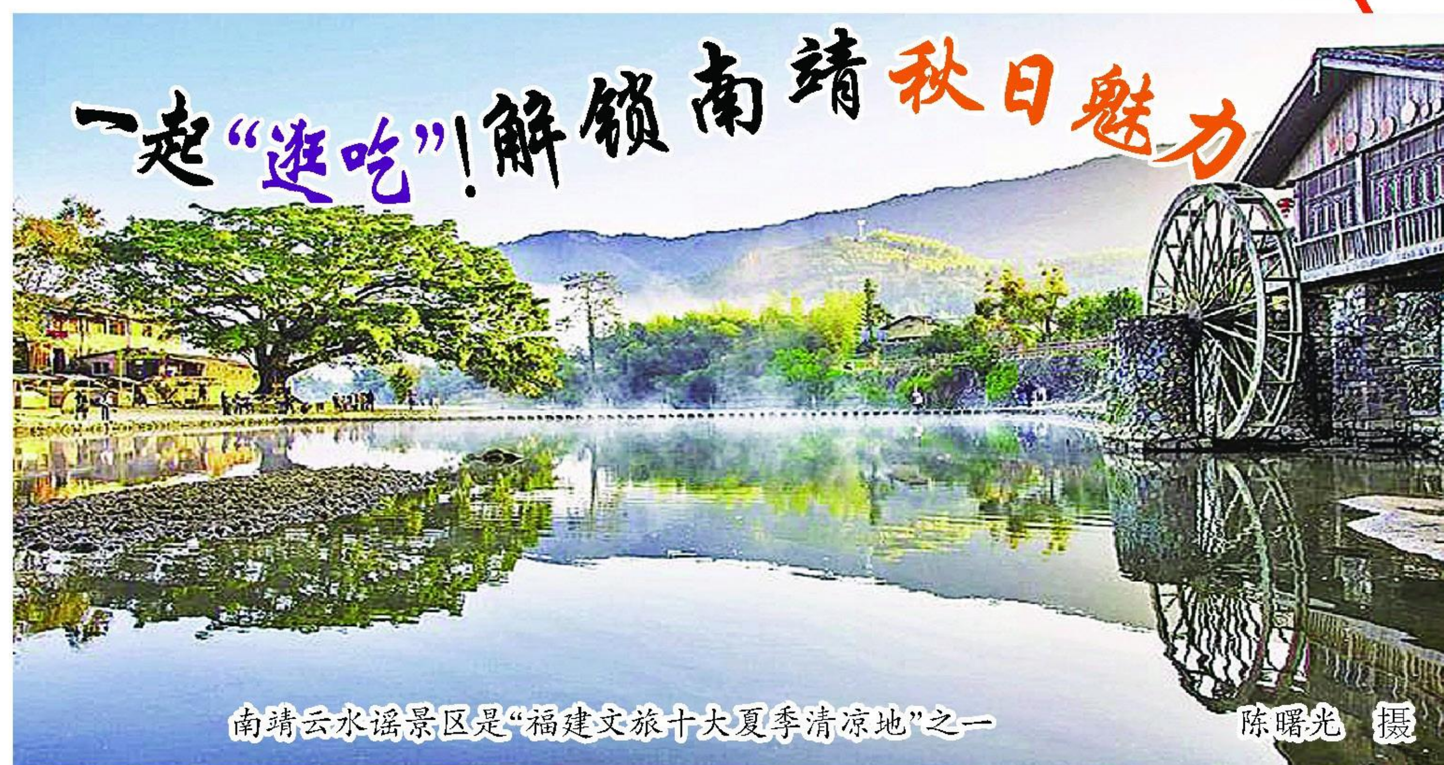
南靖云水谣景区是“福建文旅十大夏季清凉地”之一