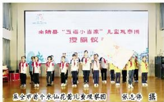
系全市首个水仙花蕾儿童观察团

儿童工作委员会牵头成立,由儿童代表、引导员和专业顾问团组成的儿童组织,旨在进一步推广儿童友好理念,创设儿童友好环境,激发儿童主人翁意识,助力实现儿童友好的愿景。首届儿童观察团21名成员从南靖县城各小学生中择优选拔,从教师队伍中聘任引导员,由县直相关部门组成顾问团,为成员提供专业指导。