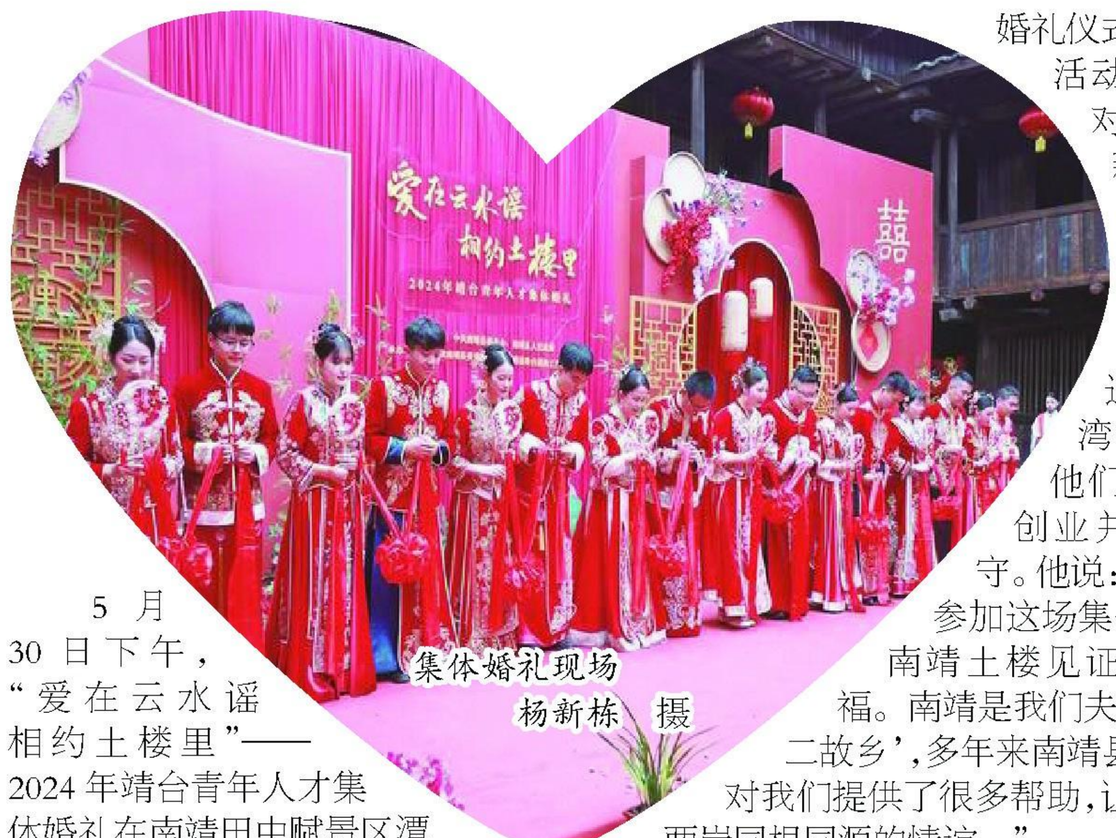
5月30日下午,“爱在云水谣相约土楼里”——2024年靖台青年人才集体婚礼在南靖田中赋景区潭角楼举办。活动邀请了8对漳台青年人才,为他们举办了一场喜庆热闹的传统中式婚礼。