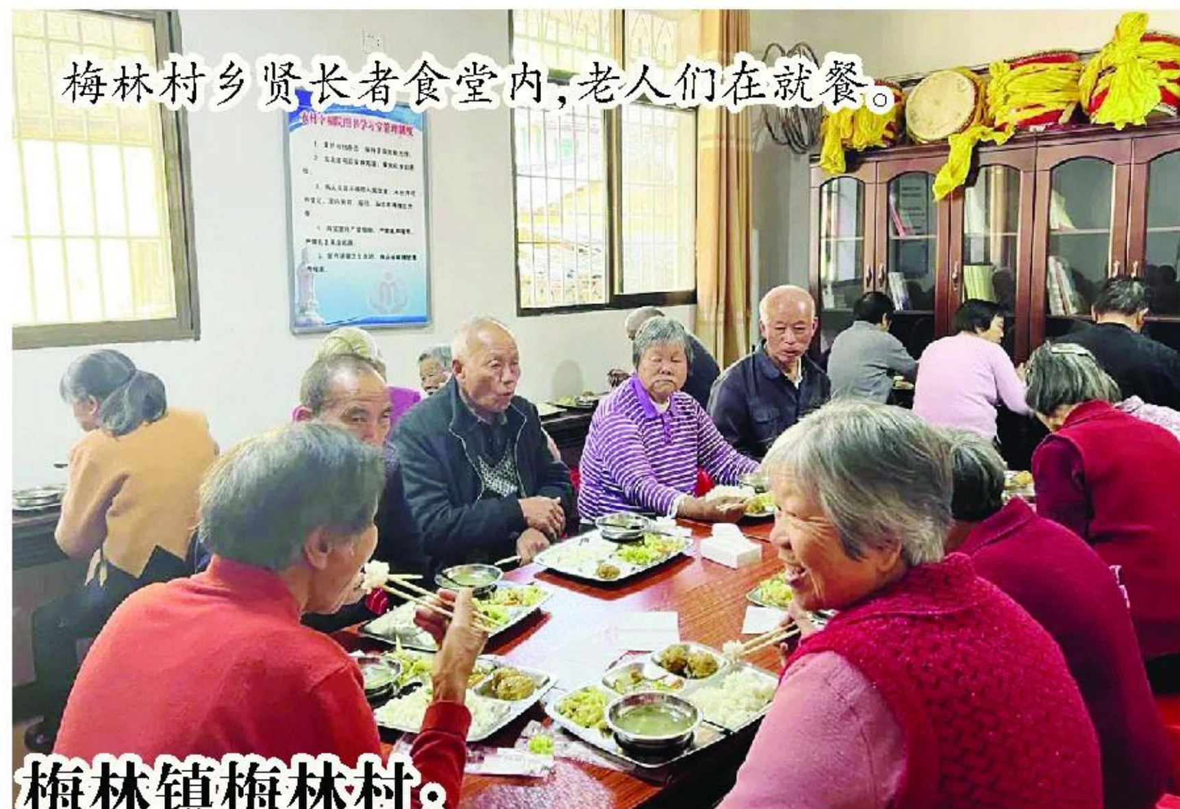
梅林镇梅林村:乡贤反哺

据了解,农业产业化省级重点龙头企业是重在突出引领乡村产业发展、促进农民就业增收、实现农业农村现代化等方面发挥示范带动作用的农业企业。经过多年的发展,龙山镇孕育出20家县级以上农业产业化龙头企业,其中省级7家,市级4家,极大带动了龙山镇现代农业的发展。下一步,龙山镇将按照“绿色兴农、品牌强农、产业强镇”的发展思路,紧盯三张“国字号”名片的目标,持续推行种养加一体化现代农业发展。