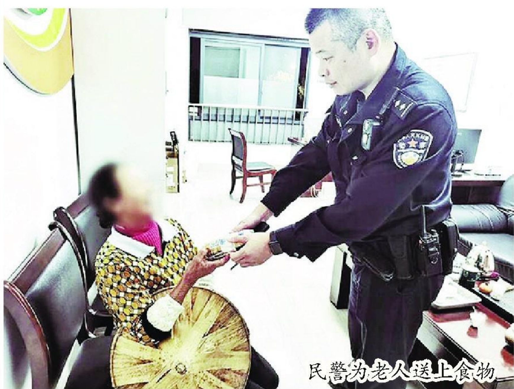
民警为老人送上食物

本报讯“感谢警察同志帮我找回母亲,她要是出了什么意外,我都不知该如何是好。”近日,一位七旬老人外出散步不慎迷失街头,所幸在县公安局山城派出所民警的帮助下,顺利找到家人。