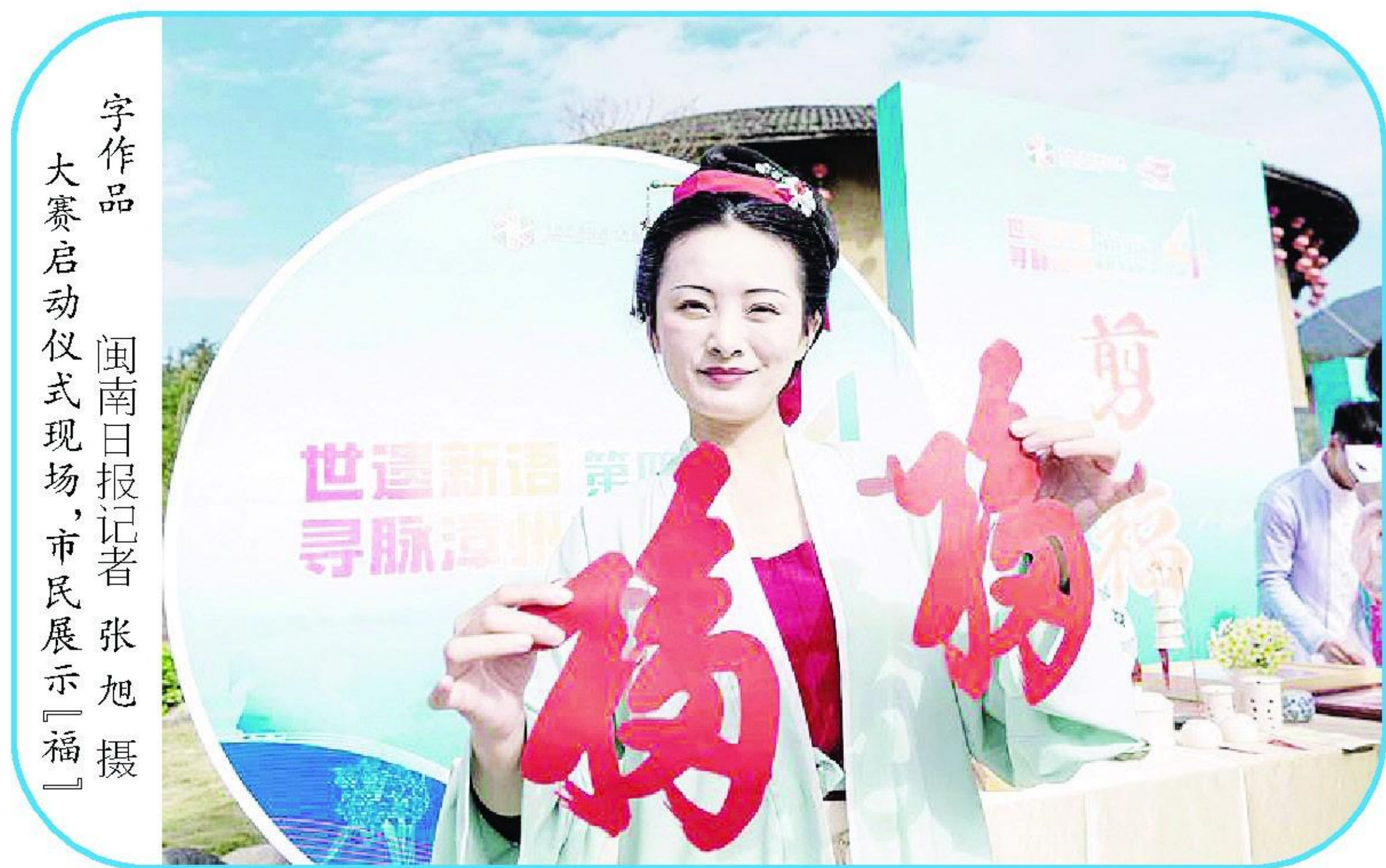
字作品 大赛启动仪式现场,市民展示「福」

本报讯(记者 庄朝惠)1月12日,以“世遗新语 寻脉漳州”为主题的第四届漳州市文创设计大赛在南靖启动。作品征集截止时间为3月15日。