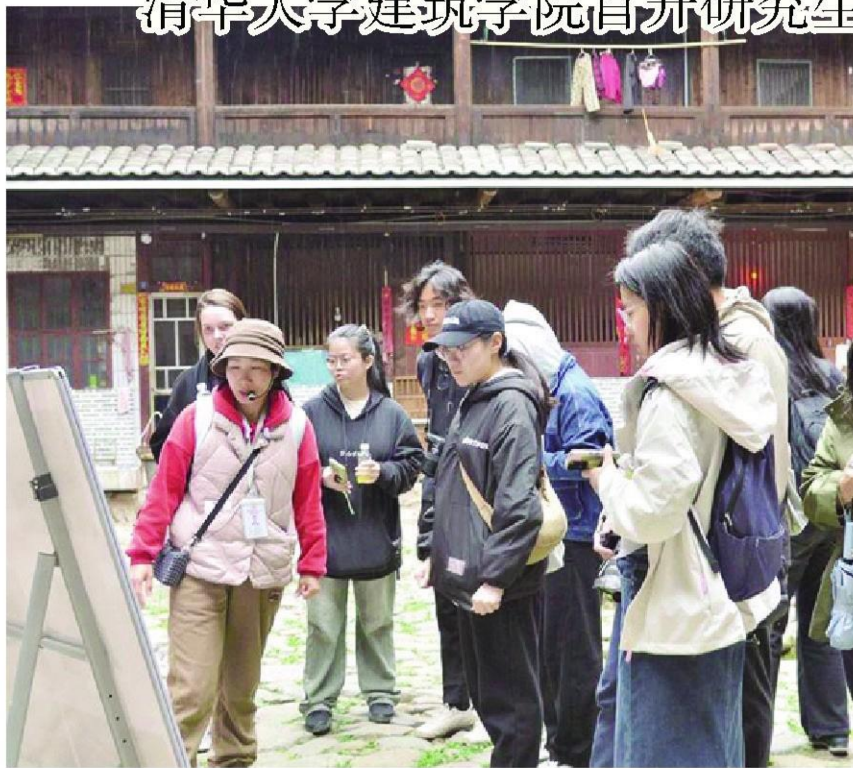
清华大学建筑学院师生走进南靖土楼

本报讯(记者 庄朝惠 通讯员 李小琴 文/供图)2月29日至3月1日,清华大学建筑学院师生走进南靖土楼,开展世遗土楼以及部分非世遗土楼的活化利