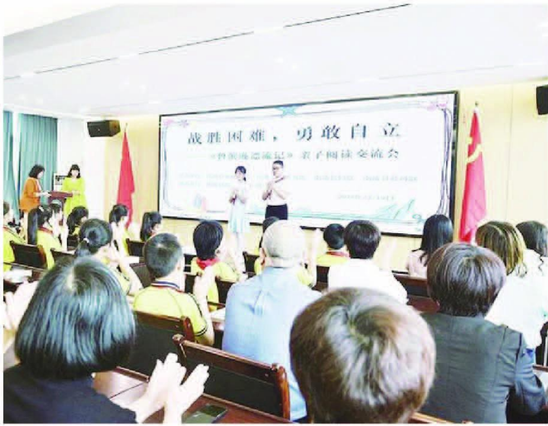
“知子花开·童阅书香”亲子阅读主题活动现场

本报讯(杨新栋 陈素云)近日,南靖县举办“知子花开·童阅书香”亲子阅读主题活动,旨在进一步深入贯彻党的二十大精神,贯彻落实习近平总书记关于注重家庭家教家风建设的重要论述和关于推动全民阅读的重要指示精神,帮助家长儿童养成爱读书、读好书、善读书的良好习惯,推动亲子阅读在南靖县蔚然成风。