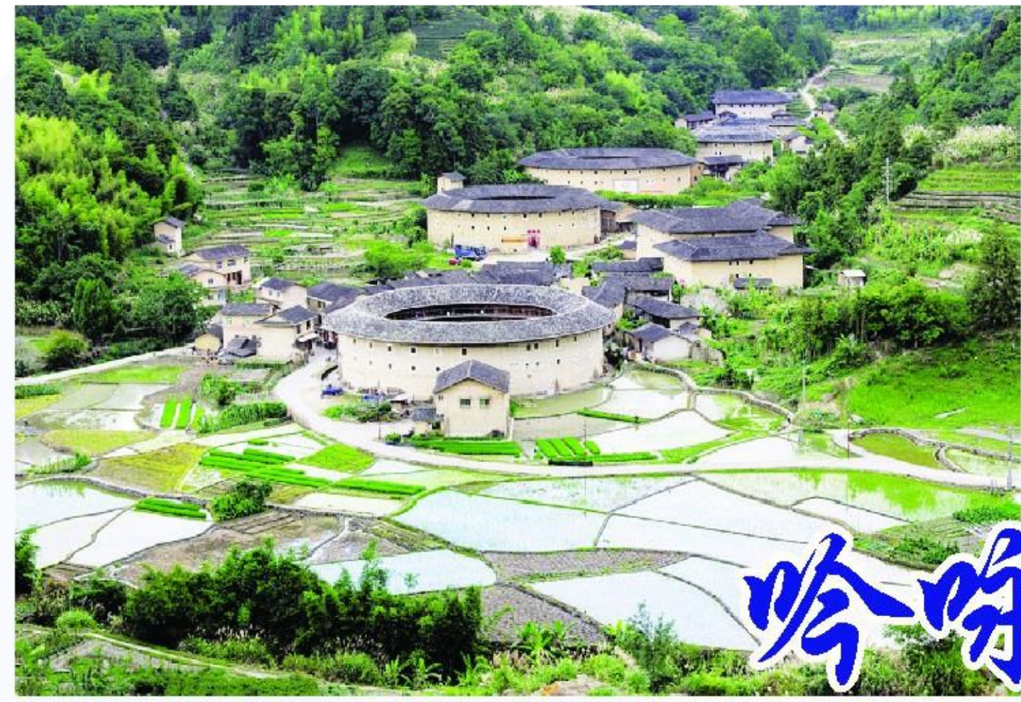
河坑春色