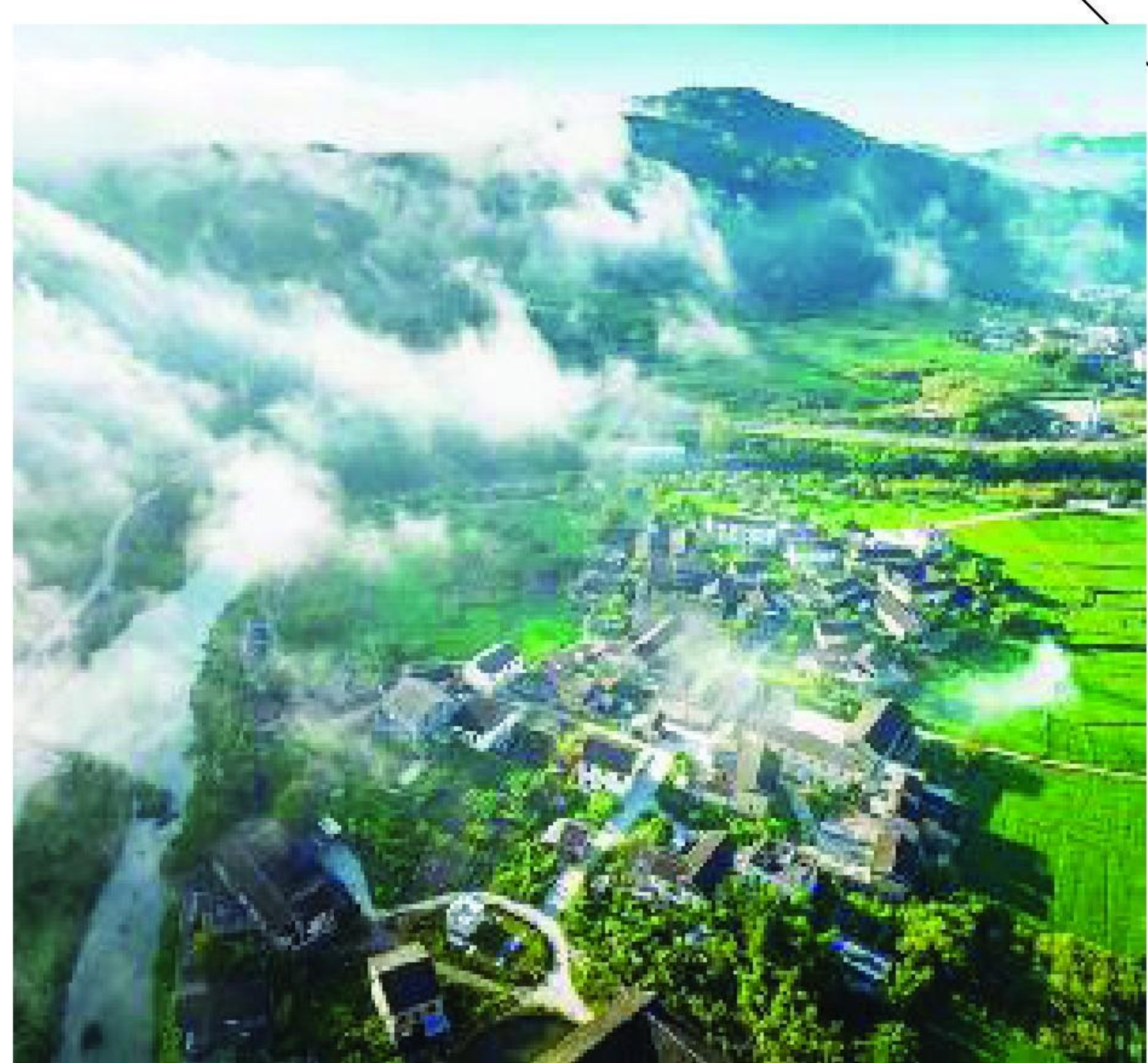
福建土楼(南靖)景区水系发展,为土楼“添色”。