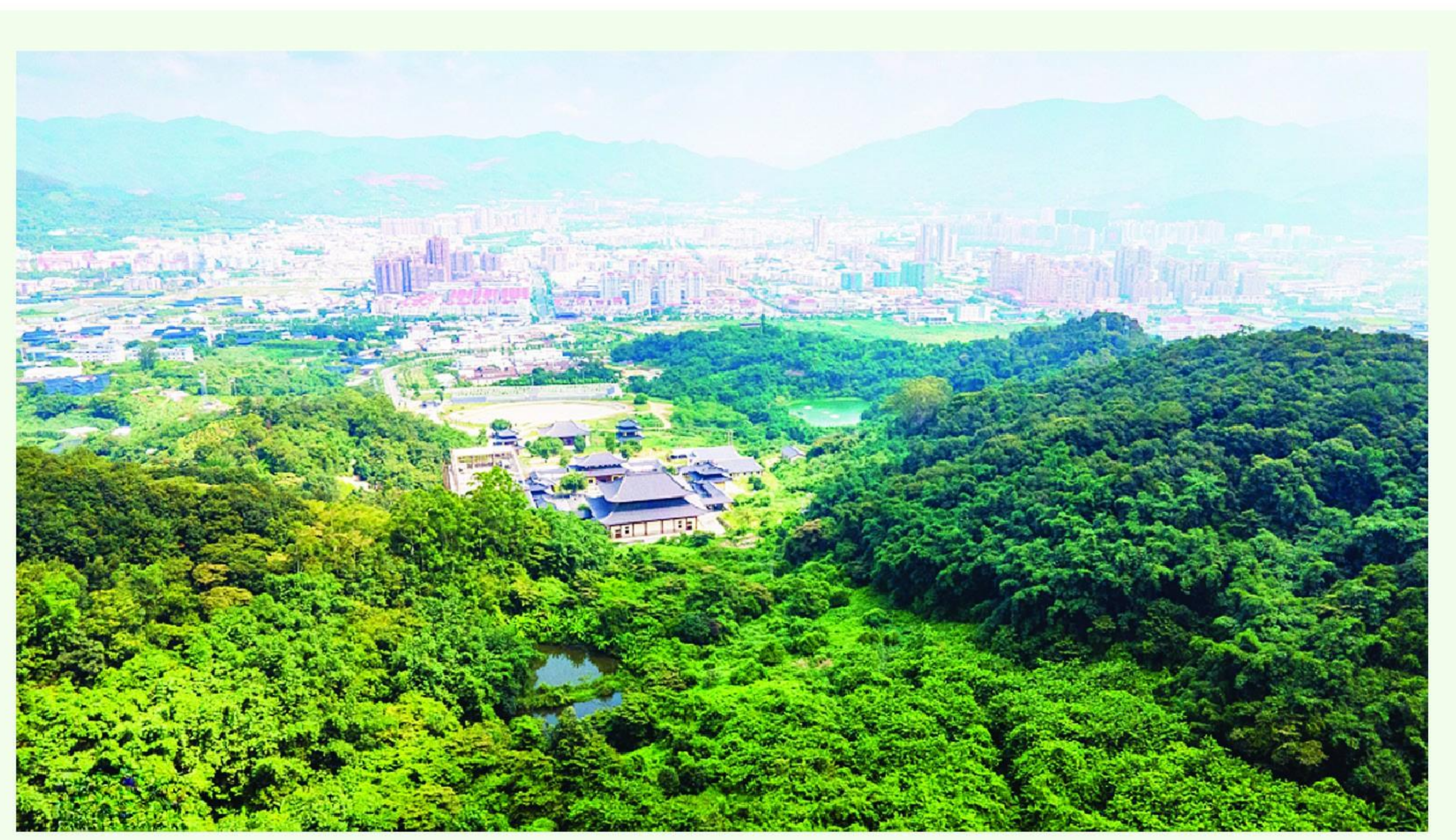
日新月异

柿子因其橙红喜庆的形象广受中国人民欢迎,寄予其美好寓意颇多,常见有谐音替作的“柿柿如意”“好柿发生”“心想柿成”等,正与它的圆润丰腴相得益彰。若是让我择一祥词提在楹联横批处,我定极力推荐“喜柿多多”,既吉利讨喜,又满足了我馋嘴贪食的愿望,多多益善,可谓一举两得。