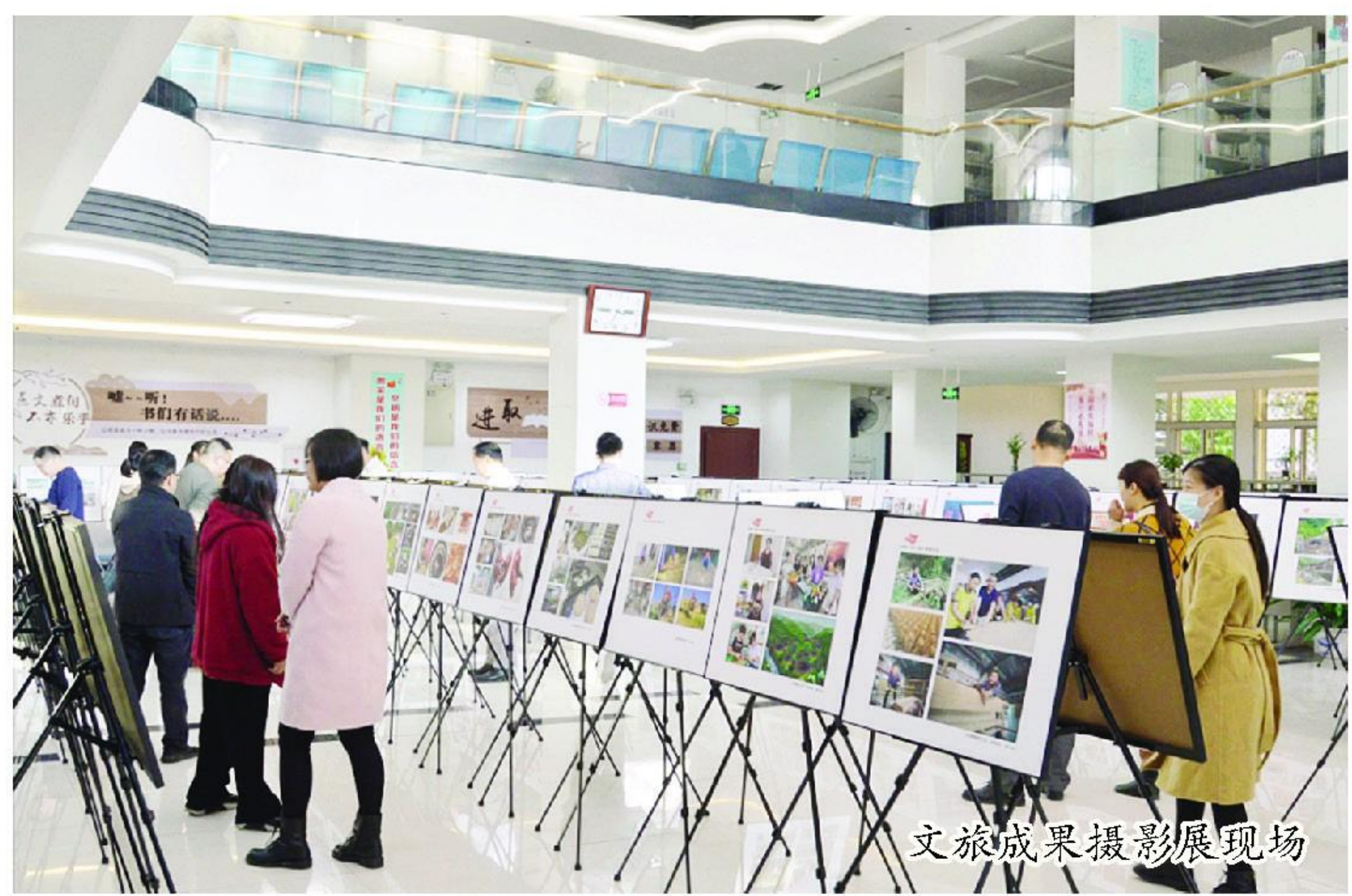
文旅成果摄影展现场