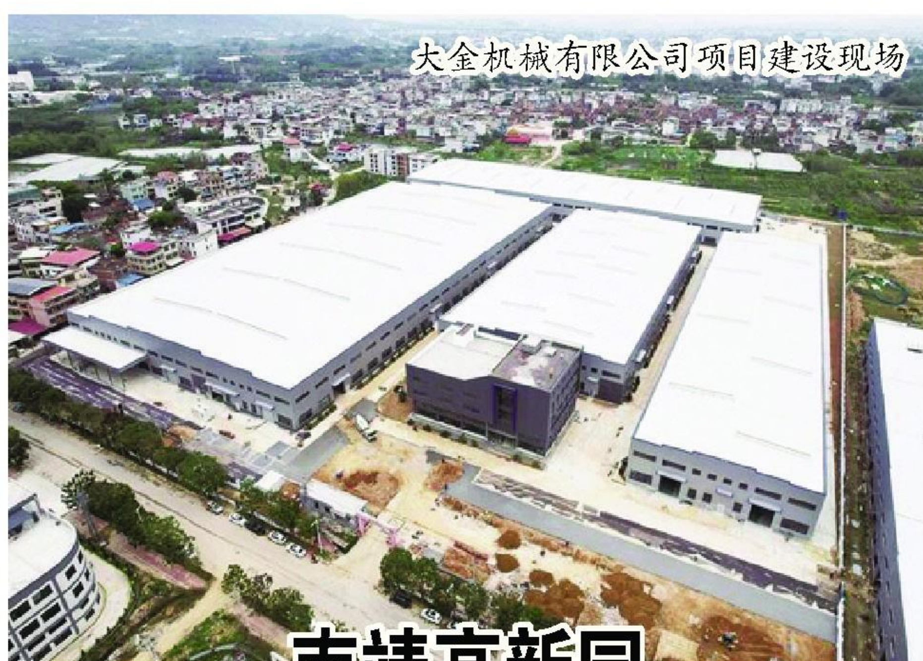
大金机械有限公司项目建设现场