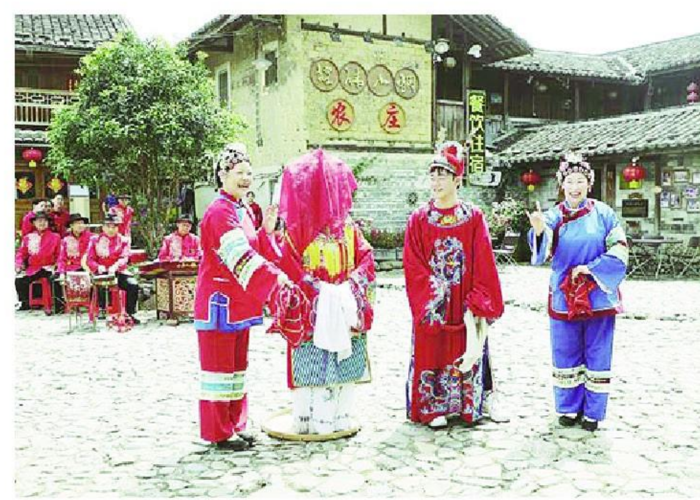
代表团成员在云水谣体验土楼娶亲民俗

近年来,漳州市加快推进中菲经贸创新发展示范园区建设,市外办以深化人文交流、促进产业合作为抓手,积极推动各县区与菲律宾等国家城市“结亲”。此前,漳州市及云霄县、东山县分别与菲律宾巴朗牙市、塔巴科市、达古潘市缔结友好交流城市,以此为平台深化人文互访与经贸交流。