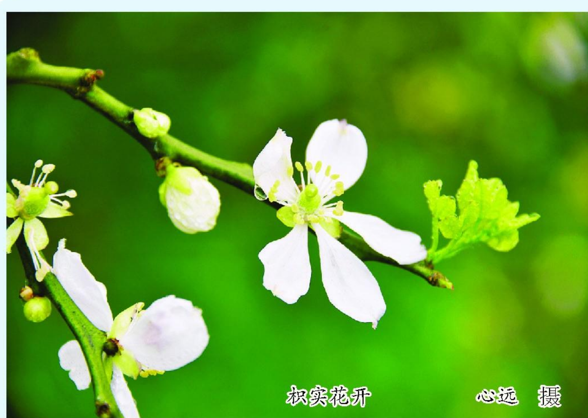
枳实花开 心远 摄