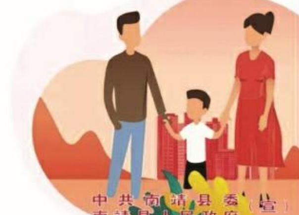
中共南靖县委 南靖县人民政府

社会主义核心价值观： 富强 民主 文明 和谐 自由 平等 公正 法治 爱国 敬业 诚信 友善