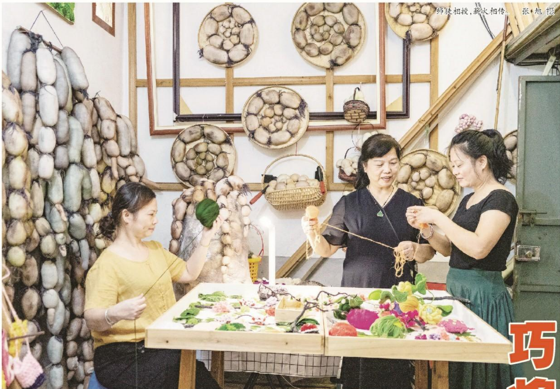
师徒相授,薪火相传