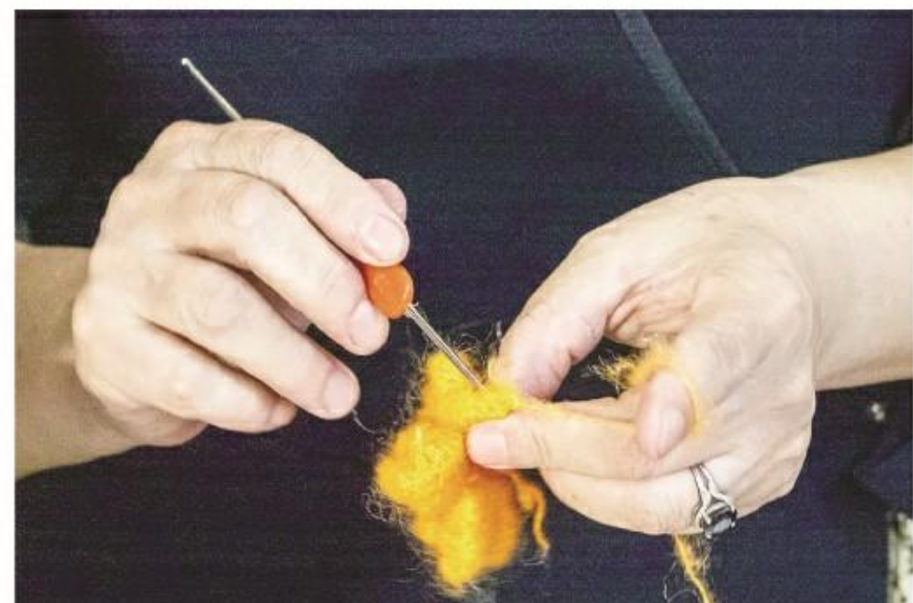
钩针技艺