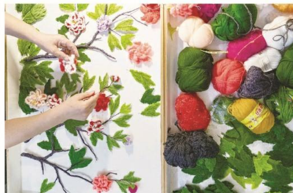
柔软的毛线变身多彩的图画