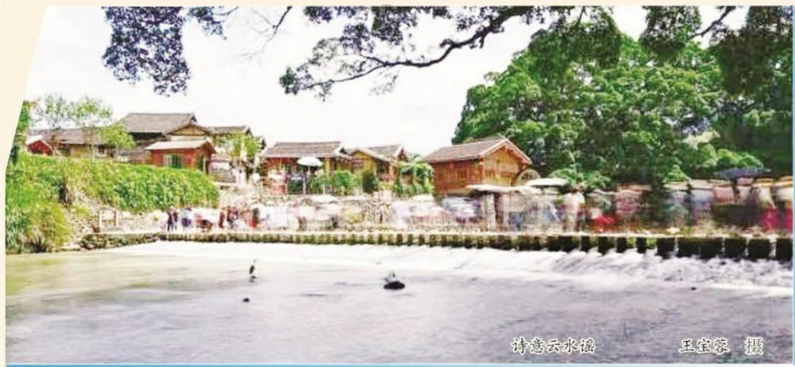
诗意云水谣

把她拥入水的梦想 于是，这里 每寸土壤都绽放阳光的温暖 每缕清风都飘散月的香气 从此 那溪边老榕树的每片树叶传唱着 云和水的歌谣 悠长，悠长