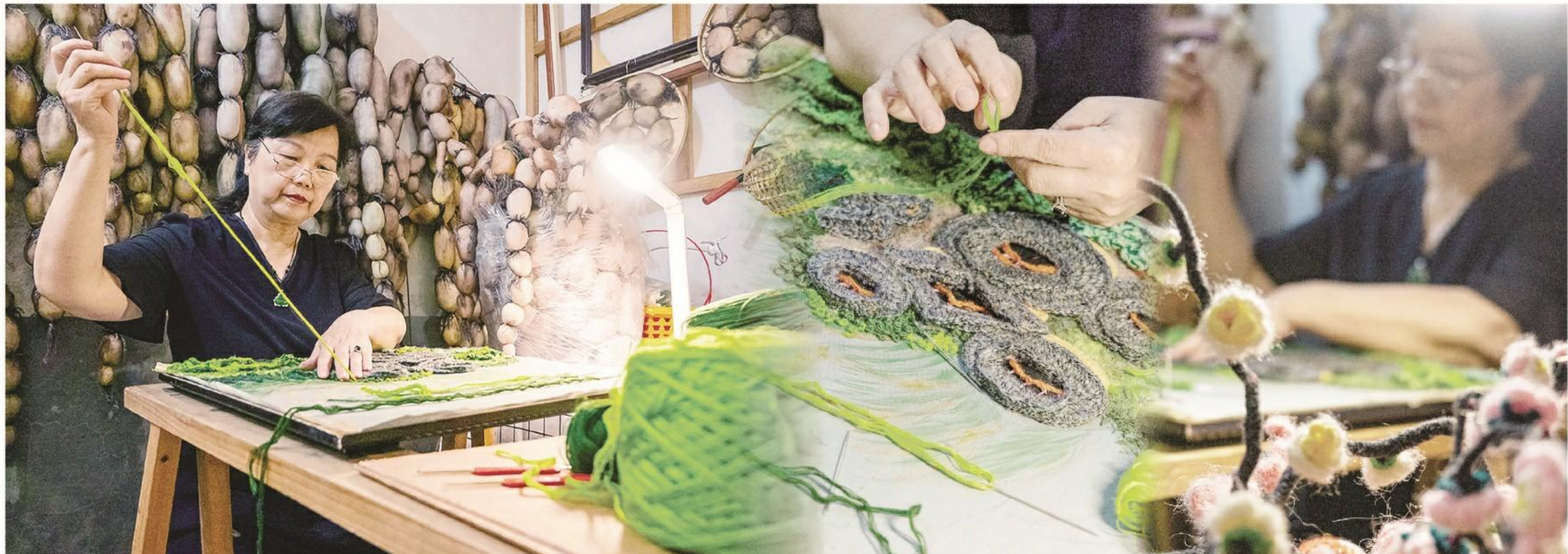
浮法刺绣技艺