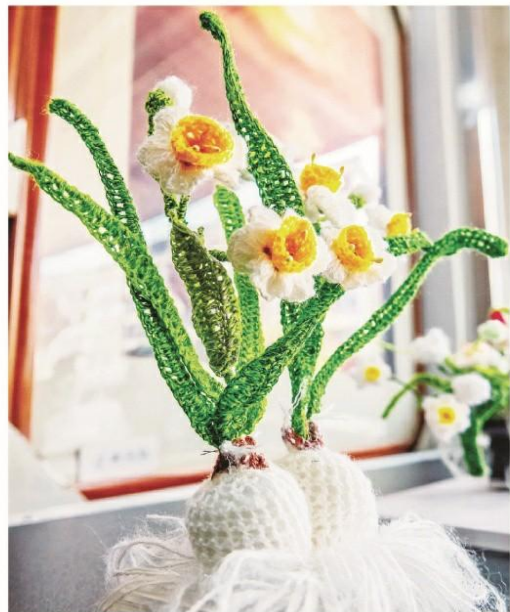
毛线编织作品(水仙花)