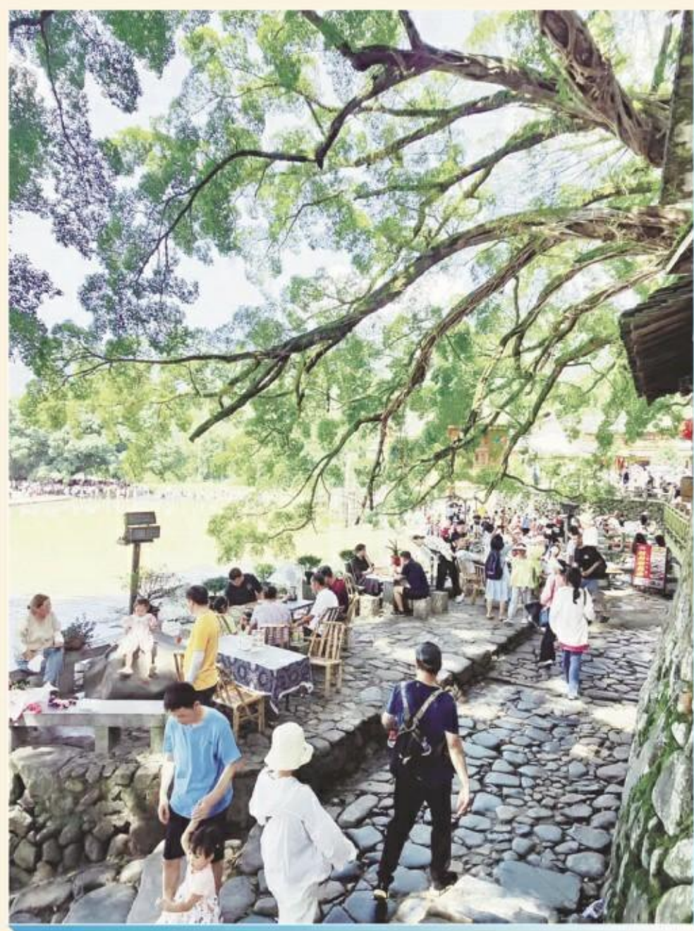
夏日云水谣，清凉小世界。