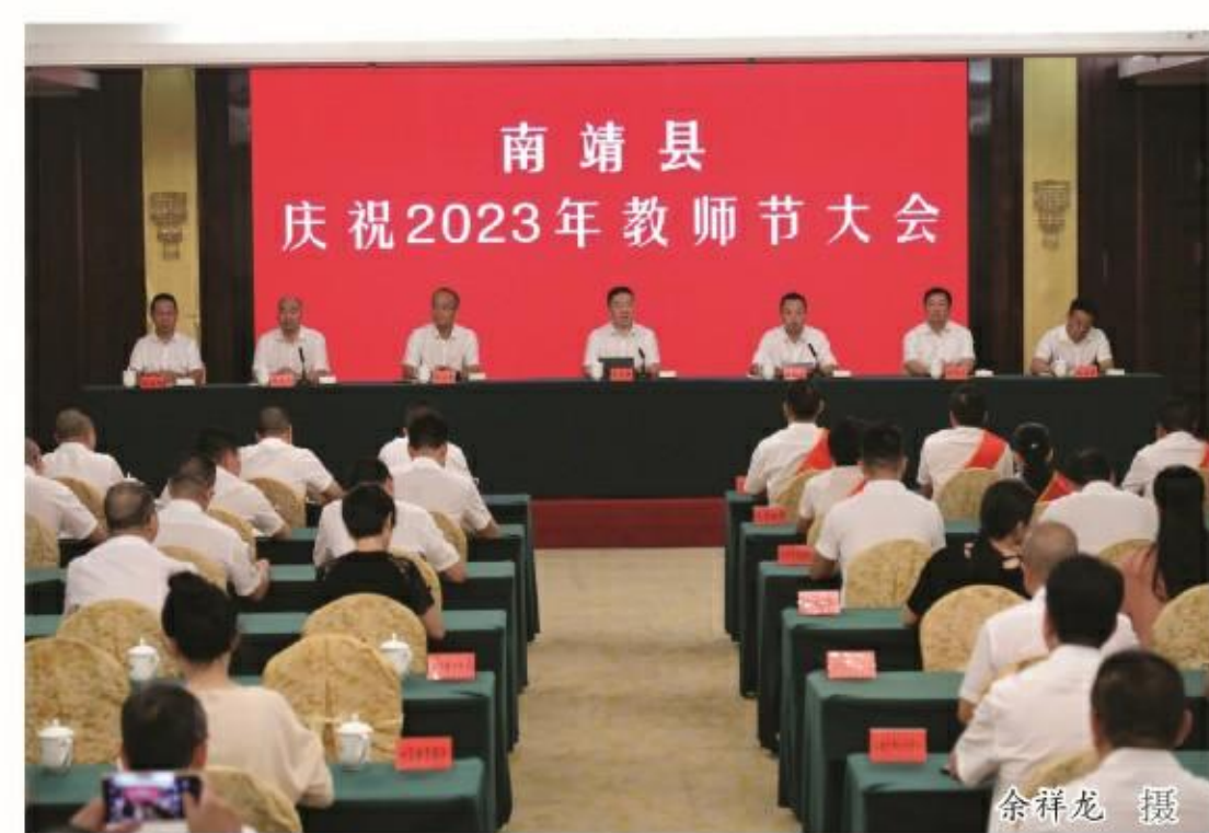
化教育领域“放管服”改革，办好教育惠民工程，不断提升办学质量。要建设高素质教师队伍，加强师德师风建设，构建教师专业发展体系，提升教师专

本报讯(记者 马嘉伦 吴靖)9月8日，我县召开2023年教师节庆祝表彰大会，总结成绩、表彰先进、展望未来，激励广大教育工作者不忘初心、牢记使命，动员全县上下以更坚定的信念、更务实的作风、更有效的举措，办好人民满意的教育，加快建设教育强县。 县领导李志勇、蔡铭泉、林文生、陈群伟、沈惠平、赖国贤、陈志明、各镇(园)、土楼管委会、县直有关单位负责人及各教育单位、受表彰单位和教师代表参加会议。 县委书记李志勇指出，一年来，县委、县政府以办好人民满意的教育为目标，始终坚持教育优先发展战略不动摇，持续加大教育投入，深化教育改革，推进教育现代化，全力打造教育强县，教育事业取得了明显成效。李志勇强调，要构建高质量教育体系，加快学前教育普及普惠发展，实施高中阶段教育提升计划，加大改革创新力度，深化教育领域“放管服”改革，办好教育惠民工程，不断提升办学质量。要建设