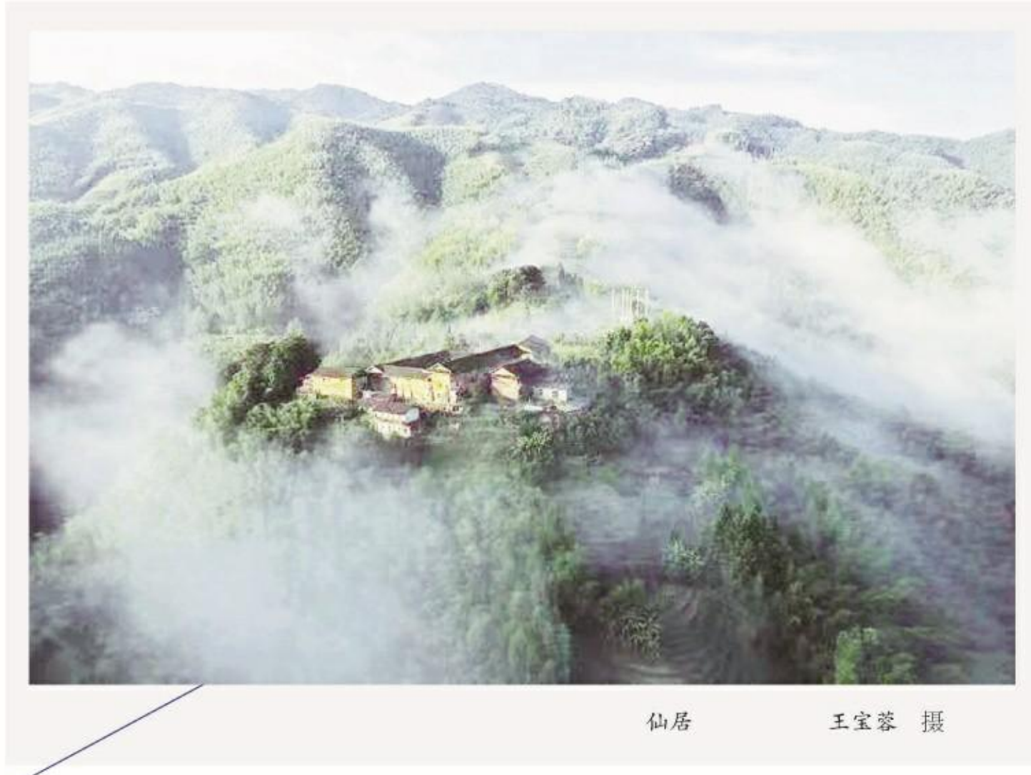
仙居 王宝蓉 摄

关注老年教育,关心老龄人的情感生活,以一种特别耐心特别温馨的人文关怀,让老年人过着幸福的有尊严的晚年生活,是一种社会责任。人间重晚晴,我是老年大学一名学员,我愿在老年教育迈进新征程的征途上,摇旗呐喊,击鼓催征。