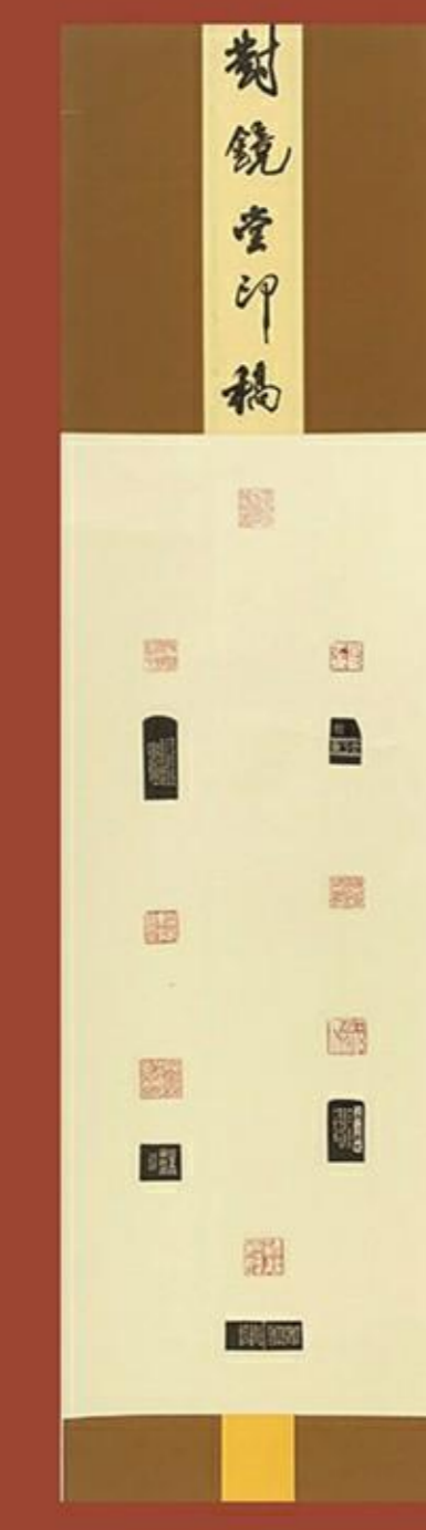
劉鏡堂印稿 吳志光書