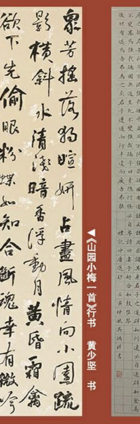
山園小梅一首笈書 黃少堅書