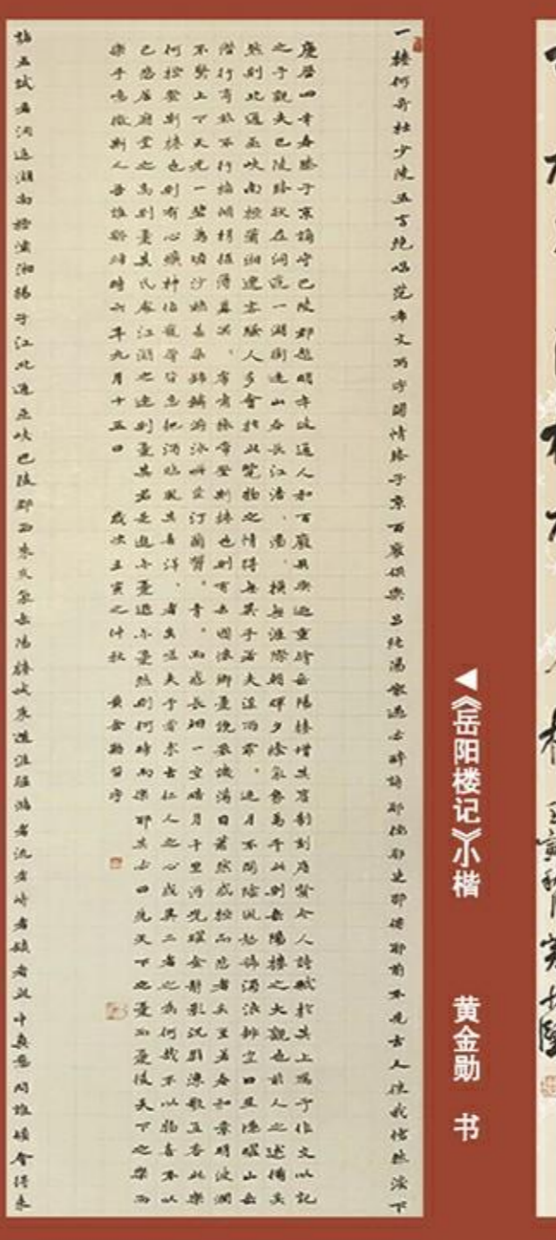
岳陽樓記不備 黃金勛書