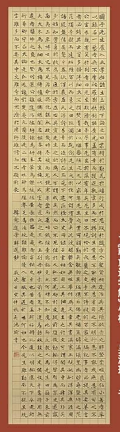
薛愈進學解不備 吳鴻翰書