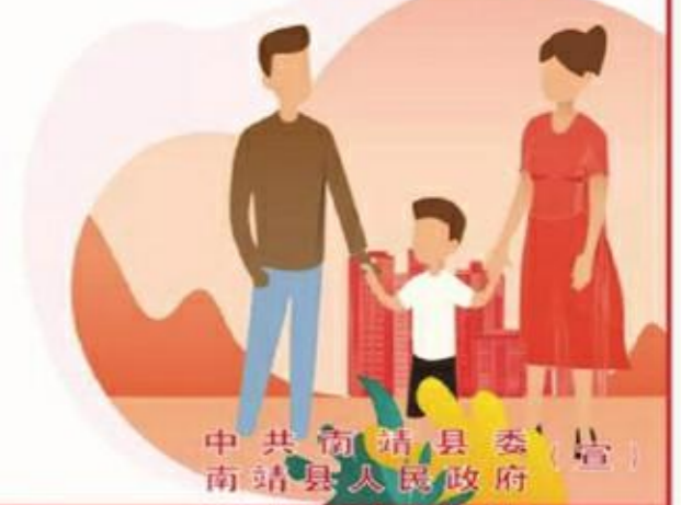
中共南靖县委 南靖县人民政府

社会主义核心价值观： 富强 民主 文明 和谐 自由 平等 公正 法治 爱国 敬业 诚信 友善