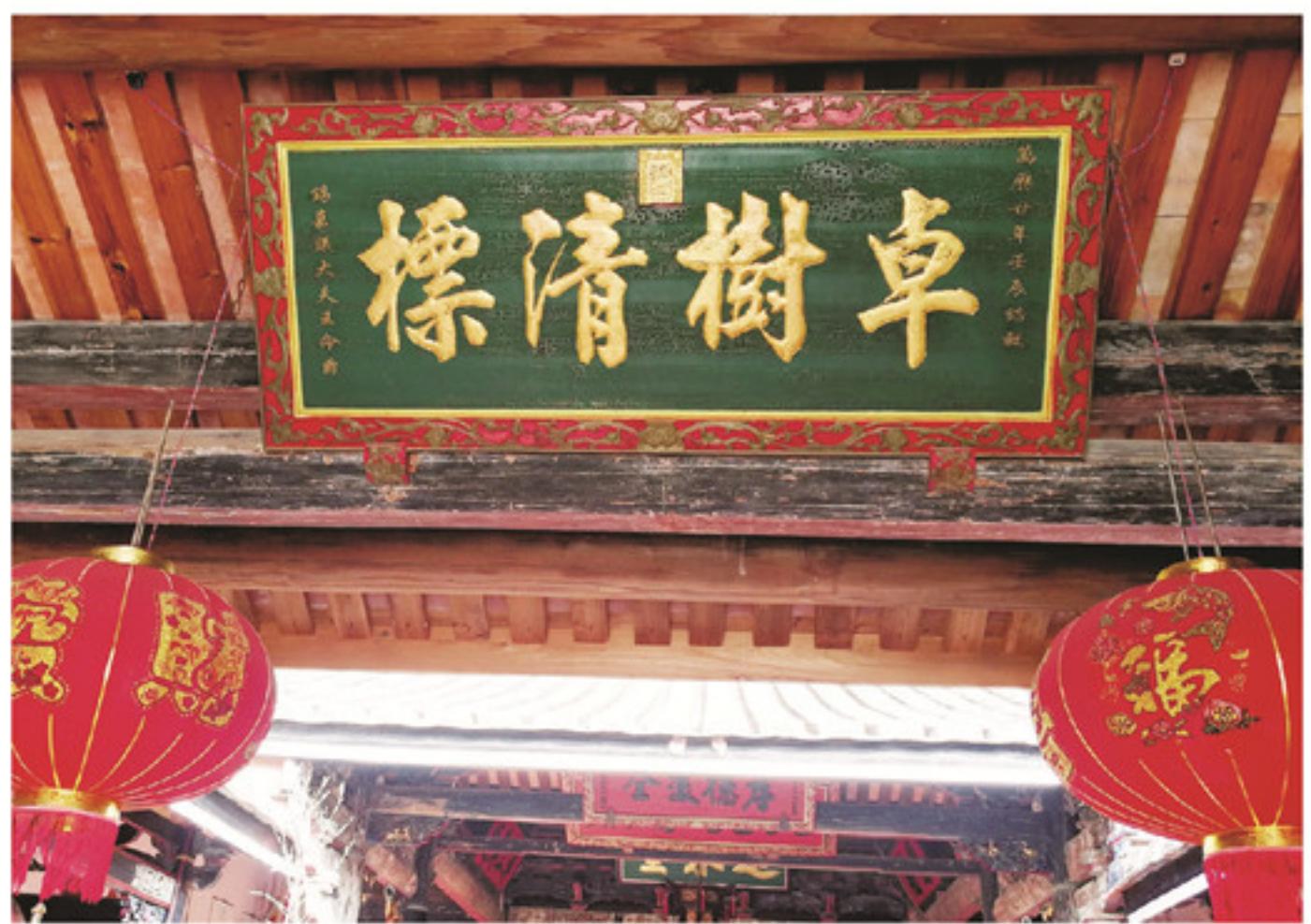
明朝方历皇帝御书「卓樹清標」匾

王命爵(1525-1603年),字仁卿,号一所。明朝嘉靖四年农历二月三十日戌时,王命爵出生于福建省漳州市南靖县金山新内村石桥。