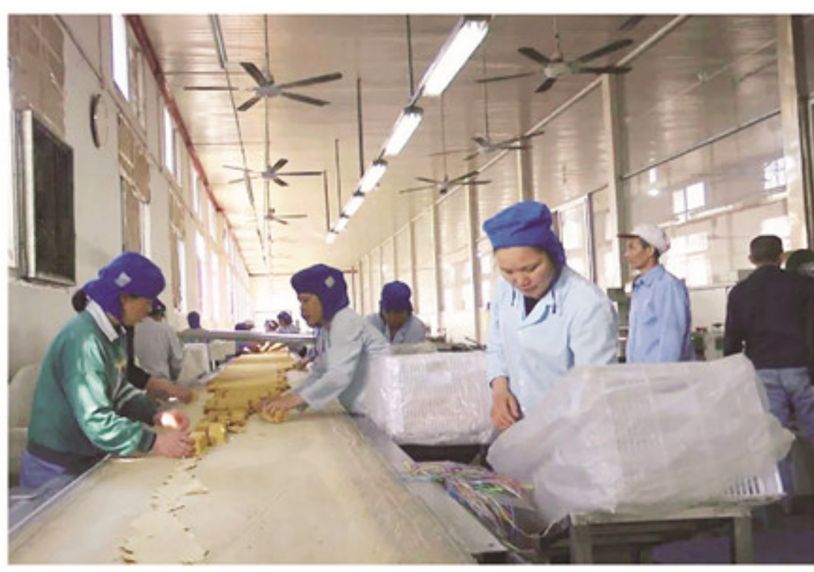
在东旺食品有限公司生产车间,流水线上的工人们分工协作,正在为新鲜出炉的各式饼干进行加工与包装。

本报讯(记者 马嘉伦)近日,中国旅游协会休闲农业与乡村旅游分会发布《2020 年全国 30 家醉美休闲农庄公示名单》,其中我县紫云山生态旅游有限公司榜上有名。 紫云山取意紫气氤氲,云蒸霞蔚,这里山脉连绵,起伏跌宕,终年云雾缭绕,紫气盈空,每逢东升旭日,霎时佛光冲天光芒万丈,宛若置身仙境。 紫云山庄位于紫云山上海拔近 1000 米处,总体