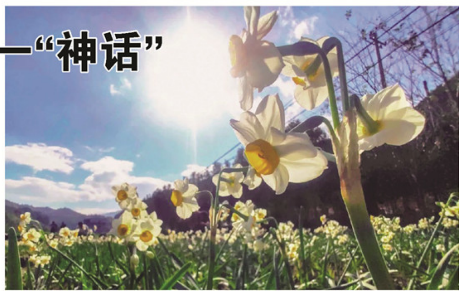
在书洋镇奎坑村,大片的水仙花迎着阳光恣意绽放。

寒,后期喜温暖。奎坑村位于大山深处,海拔在 500 米左右,拥有得天独厚的自然环境,非常适合水仙栽培,所以在这里培育的水仙花,各方面都会优于其他地区。 闽南师大生物技术学院院长陆奎眉说:“经过我们这两年的初步试验,整体上来讲,花的长势,花枝的长度,花朵的大小,包括叶子的宽度,效果会比圆山那边更好一点,我们想对项目再做一些数据分析,用数据来说话。” 据了解,奎坑村主动对接高校和科研单位,按照“新型经营主体+高校科研单位+村民”模式,扩大水仙种植规模,探索水仙的高山保育