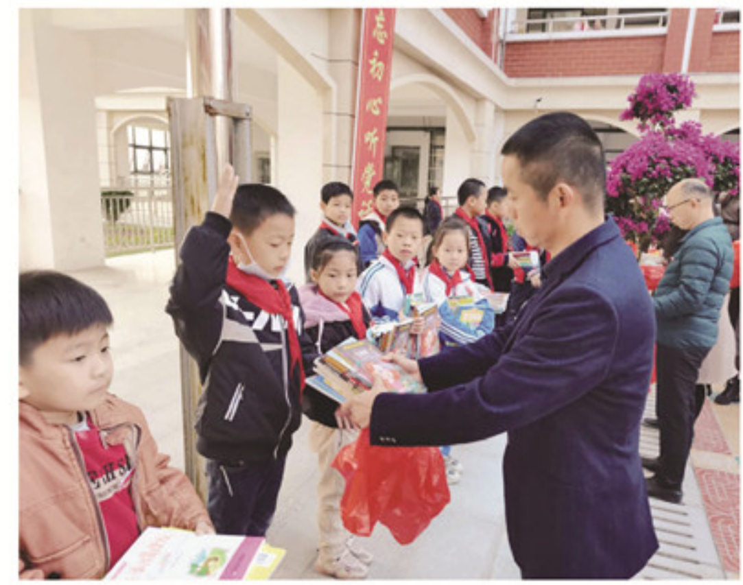
金山中心小学举行「合彬助学」捐助活动

当日上午8时,活动在经典传唱人表演的舞蹈和朗诵中拉开序幕,随后全校师生共同诵读《论语》学而篇。